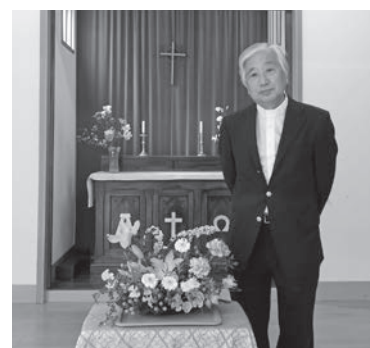
小名浜聖テモテ教会にて

東北教区の司祭となつてBSAを再び知るところとなつたのは、岩手県室根村の室根聖ナタエル教会勤務となった時です。室根は彼らの聖地と呼ばれ、多くの熱心な聖公会の信徒・教役者を生み出していました。室根では広く地域の方々から行く先々でBSAの関与が聞かされ、実に室根聖ナタエル教会黎明期には清里キープセンターの農村宣教をモデルに熱い想いを胸に秘めた学生たちの忘れられない青春があったことを知らされました。